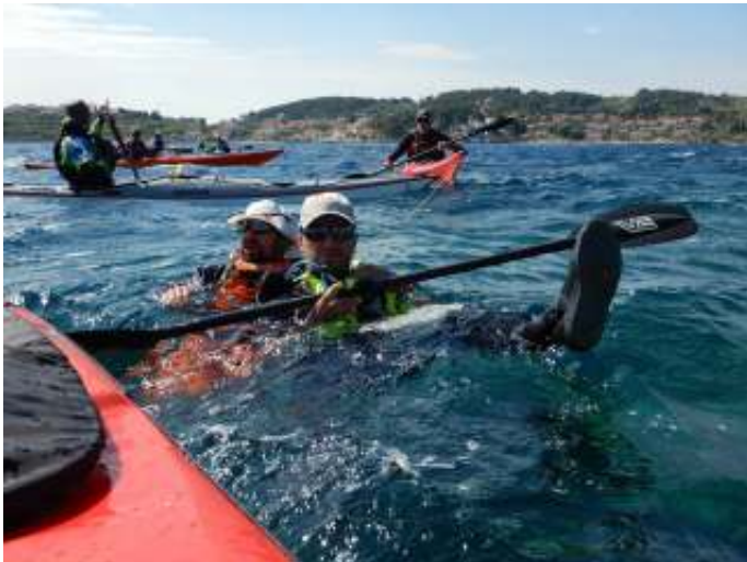
50 meter zwemmen en dan gesleept worden door je maatje met kajak

geleerd was. Leiding nemen, overzicht houden, taken verdelen enz. enz.