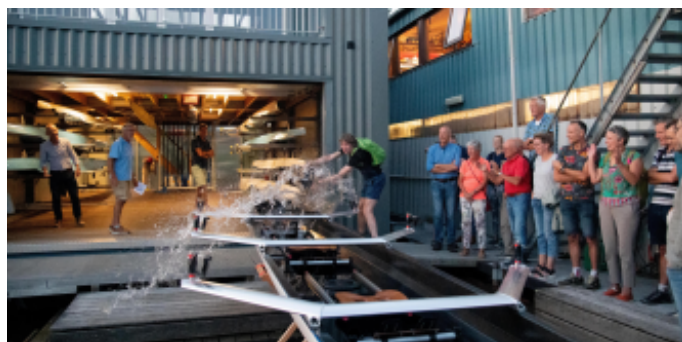
50 leden waren hierbij aanwezig. Voor de nieuwe leden extra leuk om dit mee te maken.