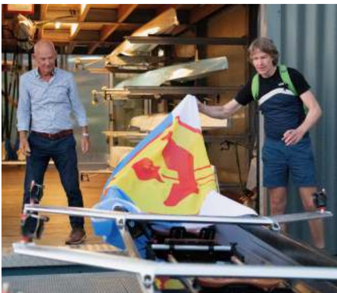
Vlak voor de doop