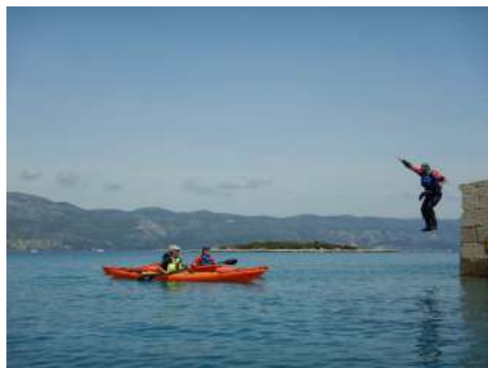
Springen van een 3 meter hoge muur

Dit ging zo 4 dagen lang waarbij de oefeningen steeds gevarieerder en complexer werden. Varen zo dicht mogelijk langs de grillige rotskust waar de golven op stuk slaan. Springen van een 3 meter hoge muur waarbij je moest wachten op je maatje die toesnelde met een lege kajak om je te kunnen redden.