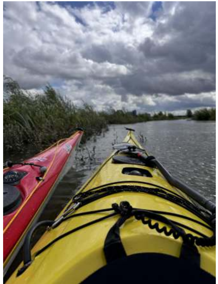
Wind en regen zorgden voor prachtige lichten.