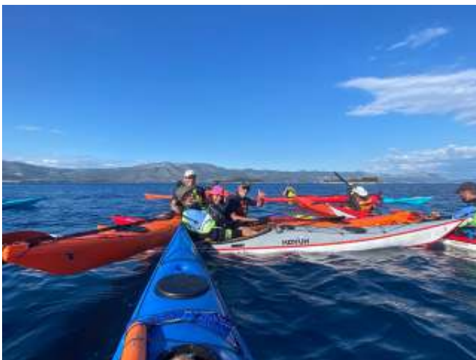
Repatriëren van een zwaar beschadigde half gezonken kajak