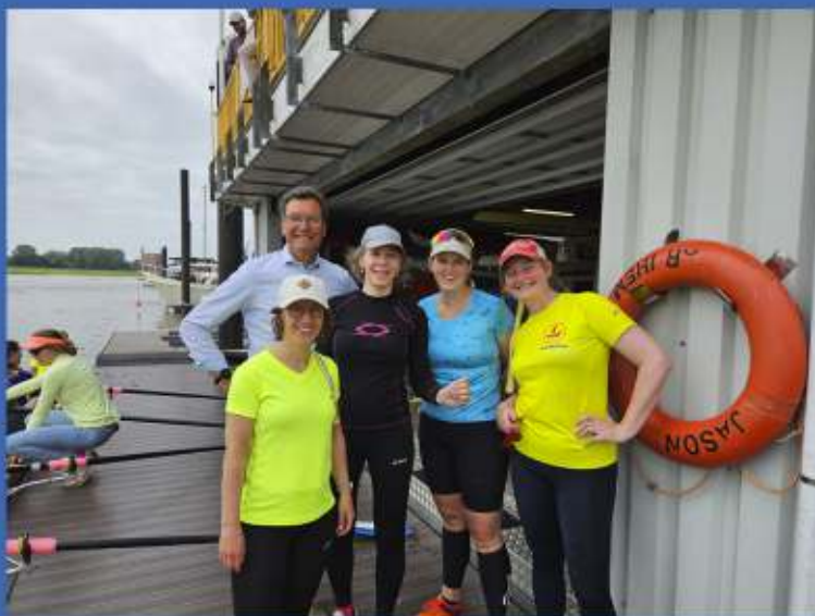
VOOR HET EERST MEEDOEN