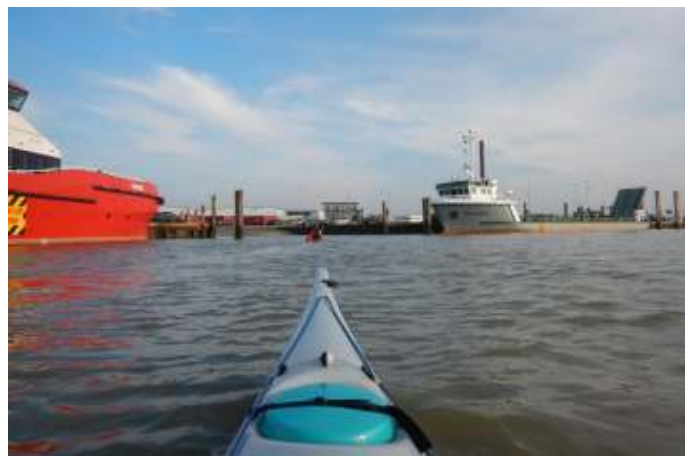
Aankomst in Norddeich

Ik ben gewend Rijnwater over mijn huid te voelen stromen; de Rijn stroomt immers voor ons. Vandaar dat ik verheugd ben op mijn oude dag een stukje stroomopwaarts te mogen. Daar kan ik mij vast oriënteren op de Rijn cruises, voor als ik zelf echt niet meer in beweging kom. Maar jullie hebben me een onderhoudskuurtje beloofd. Met een paar nieuwe schoenen en wat stellen aan riggers en dollen, moet ik nog wel even mee kunnen - ik kom tenslotte van