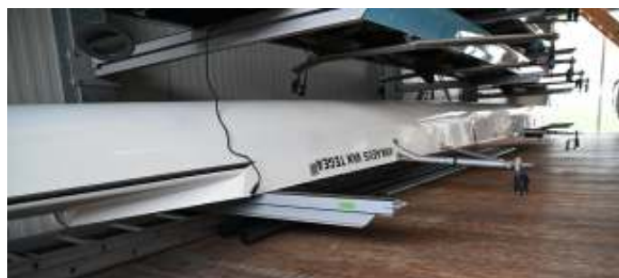
In de tweede loods ligt de opgeknapte Ankaeus de Tegea.

goede huize - zodat jullie rustig de tijd hebben om uit te kijken naar een gladdere gestuurde vier. Nog strak in z'n velletje zeg maar, daar schijnt Jason erg op te zijn gebrand.