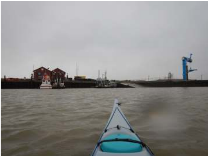
Aankomst op Juist

Hoewel er niet echt veel golven stonden, waren toch een aantal zwemmers te betreuren, die wel weer vlug in de kajak werden gezet, maar toch ook voor vertraging zorgden. Ook moesten een aantal deelnemers met een sleep op de juiste koers worden gehouden. Uiteindelijk duurde de tocht daardoor langer dan verwacht (gepland sportieve twee uur, in werkelijkheid zeer sportieve 3 uur 20 minuten!), maar de samenwerking onder alle deelnemers was voorbeeldig.