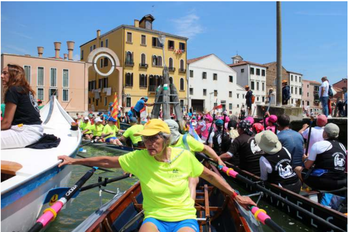
Muurvast en oefening van geduld.