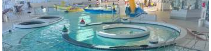
Interieur zwembad met kajaks

Onderwater orientatie, oefenen met de paddle-float