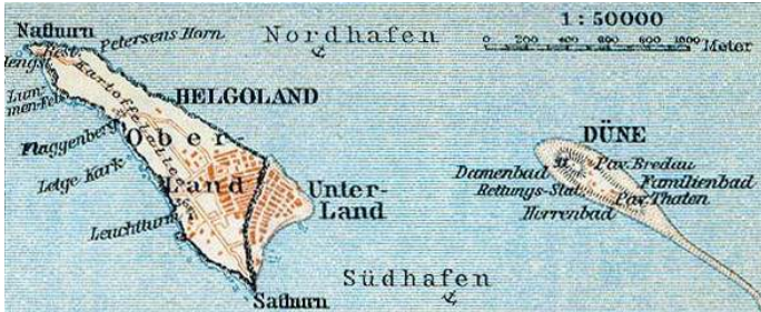
Helgoland und Duene