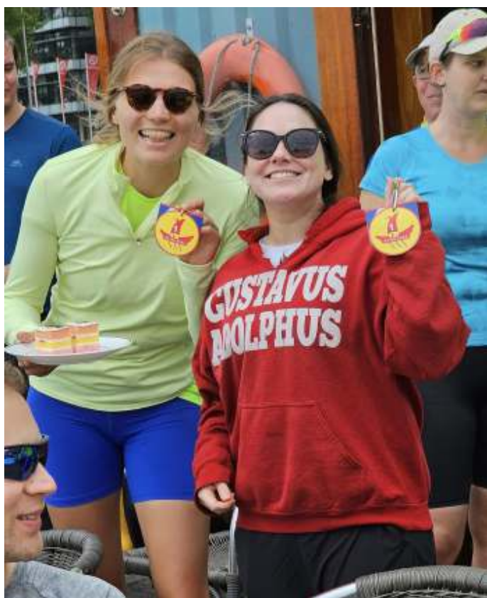
Blij met Jasonblik, zie artikel clubdag 2 juni.