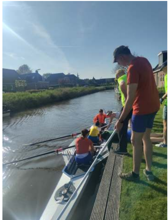
Elkaar treffen en snel wisselen: streven naar zo min mogelijk tijdverlies.

De elfstedenroeimarathon werd in 2024 voor de 38e keer georganiseerd door roeivereniging Wetterwille uit Leeuwarden. Traditioneel wordt hij verroeid van vrijdagavond na Hemelvaart tot de zaterdagavond erna. Je roeit de elfstedenroeimarathon traditioneel als prestatietocht binnen 24 uur in een C2* met een 12-koppig team: in estafette, dus. Inmiddels zijn er diverse klassementen: wedstrijd open, dames en mixed, en prestatie toer of buitencategorie met 6 of met 3 roeiers. En dan worden ook nog eco- en studententeams onderscheiden. Bij een eco-team zijn er geen volgauto's, maar wordt gefietst op de kant. Waar in het verleden nog wel eens een boot verdwaalde op het Slotermeer of bij een onhandige afslag, zijn alle teams inmiddels live te volgen via een gps systeem.