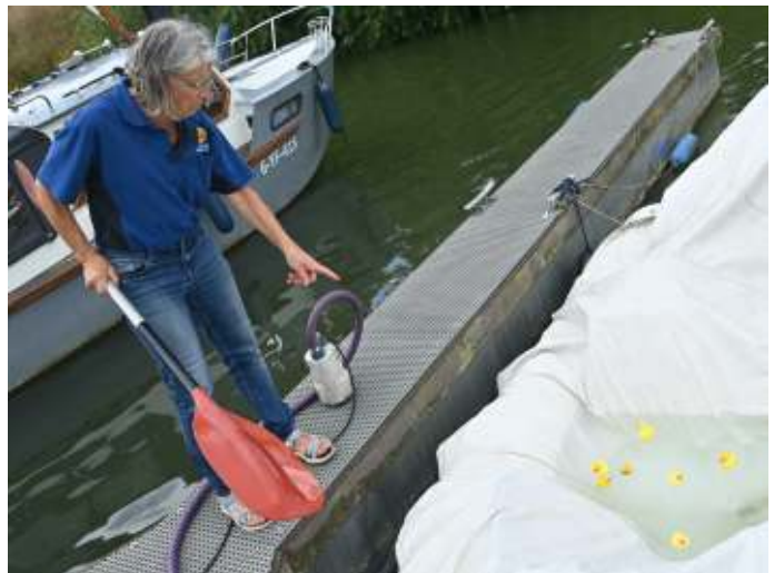
Ook de havenmeester kent in alle verantwoordelijkheden zo zijn/haar speelse elementen.