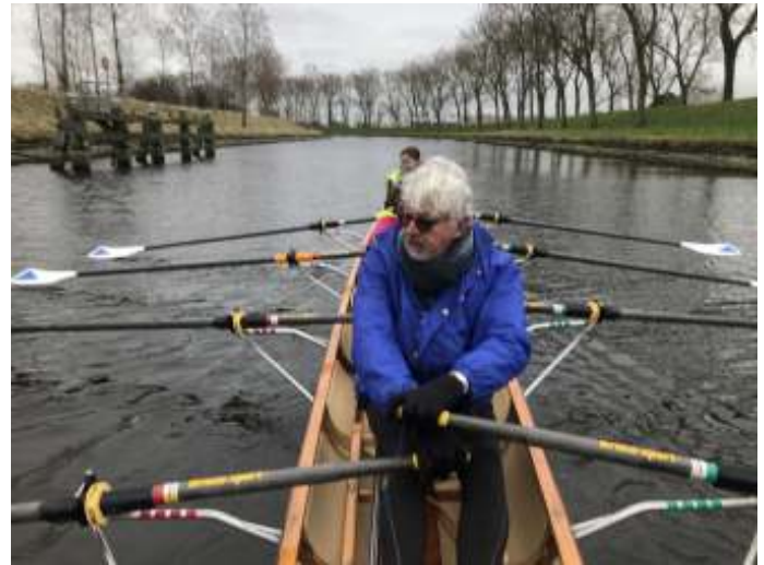
Windkracht 5 zorgde wel voor wat uitdagingen, met name op de terugweg op de Arne.

Overigens een hele heisa om de boten eerst trapsgewijze naar beneden te sjuwen om vervolgens via een roller het water in te schuiven. Bij terugkomst moet de boot de eerste meter omhooggetild worden voor plaatsing op de lage bokjes op het vlot. Dus op twee niveau's moeten er helpende handjes beschikbaar