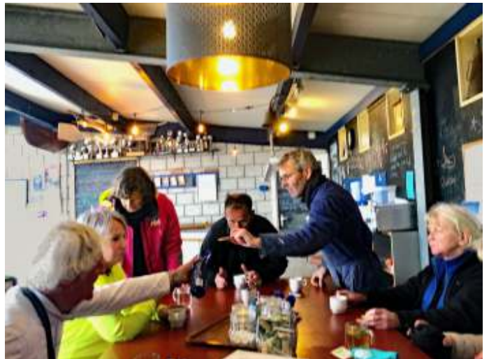
Aan de stamtafel was het een gezellige boel in de groep die elkaar al lang kent.