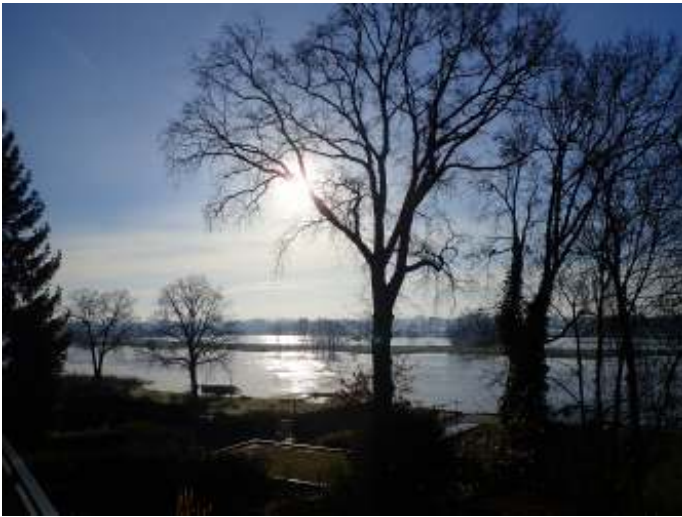
Rijn en Meinerswijk bij hoogwater, februari 2020

Het lukt niet zo vaak, Meinerswijk per kajak verkennen. Maar op maandag 8 januari 2024 waren de watergoden 9 sportieve Jasonners goed gezind: ideale waterstand rond 14.50 m boven NAP bij Lobith. Alleen dan kun je met de kajak ónder de doorlaatbrug in Meinerswijk, en óver de ondiepe drempels bij de Mandela en de John Frostbrug.