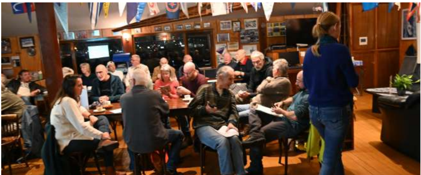
Ledenraad in november 2023. Het koepel bestuur is op deze foto buiten beeld. Zij bestaat uit het Dagelijks Bestuur (3) aangevuld met 3 voorzitters/vertegenwoordigers van de drie verenigingen die tezamen R&ZV Jason vormen.