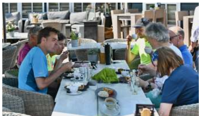
Na afloop genieten van koffie met een stuk appeltaart met slagroom. In de schaduw, want het was een enorm warme dag die zondag. In juli gaan we op een mooie zondag weer.