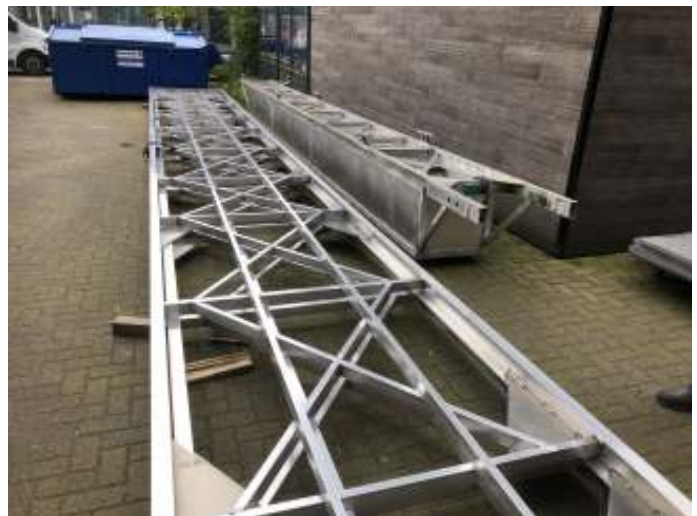
Vernieuwde frame van de steiger waar de blockroosters op bevestigd worden op Jason