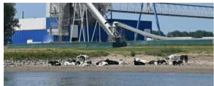
Aan doorwerken in de verzengende hitte doen deze koeien niet. Wij mensen wel; weliswaar een tandje lager.