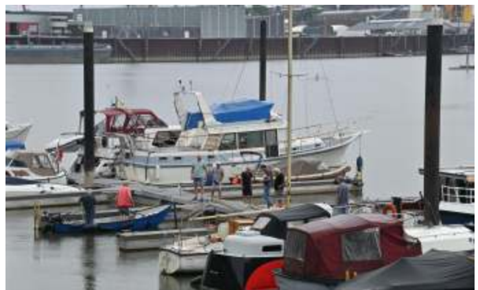
Afmaken steigers aan de Ooststeigers, een heel karwei.