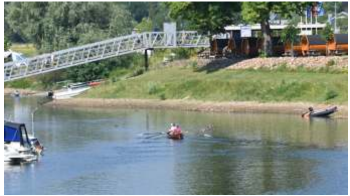
Vrij varen zonder grote vaart is best prettig. Na een rondje plas weer terug naar de stalling.