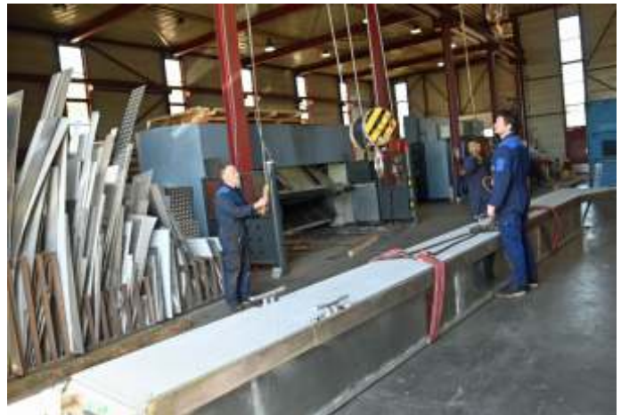
Reparatie en vernieuwing steigerdeel bij Pasman

* meerpaal : aanlegpaal, tuipaal, in het water geplaatste paal, bestemd om schepen te meren. Veel meerpalen zijn in remmingen, steigers en geleidewerken verwerkt. Losstaande meerpalen noemt men soms katpaal. Men spreekt van een spudpaal (ook wel spud, sputpaal, zwaaijaal, spijker of ankerpaal) als het een stalen (of soms houten) paal is, die door of langs het schip loopt, op en neer gehaald kan worden en waarmee een schip zich op de bodem van het vaarwater vast kan zetten.