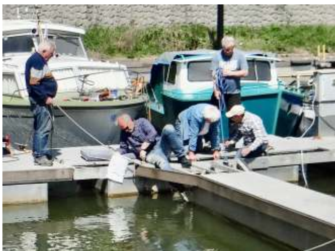
Werken aan de steigers in groepsverband

dat in 2020 tot vervanging met blokkroosters werd overgegaan waar veel Jasonleden meegeholpen hebben om deze giga klus te klaren.