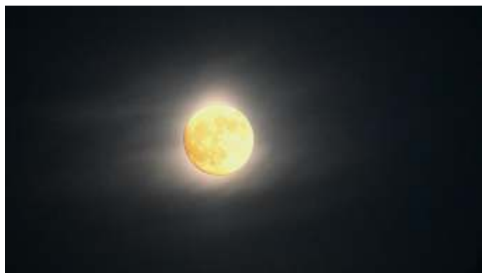
Vollemaan, bij uitstek het moment om een wens te doen.

Langzaam maar zeker ging de schemering over in de duisternis, maar echt donker werd het niet dankzij de volle maan. Je ziet vanaf het water de oever natuurlijk wel minder goed en ervaart je eigen snelheid vooral door het langsstromende water. Daardoor lijkt je veel harder te gaan, een bijzondere ervaring.