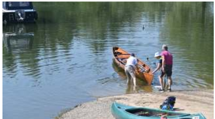
Natte voeten halen