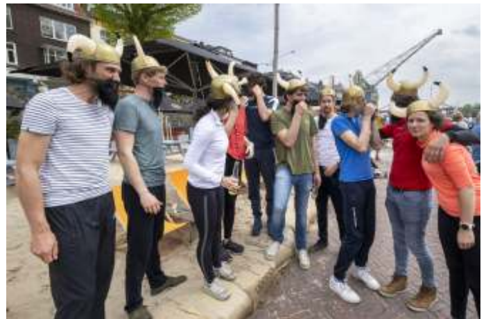
Geen vikingboot zonder Vikingen dachten zij.

„En dan te bedenken dat we donderdag nog dachten dat we de Kadedagen moesten afgelasten”, aldus de meeluisterende Helldörfer. „Er bleek iets verkeerd gegaan, ons evenement was onverzekerd. Dat kwam goed, maar toen bleek de Vikingrace niet meeverzekerd. Op vrijdag hebben we alle teams afgezegd, om