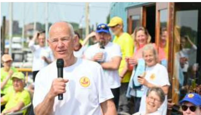
Voorzitter Geert is helemaal in zijn element. Mooie opkomst in schitterende omstandigheden. Wat wil je nog meer?