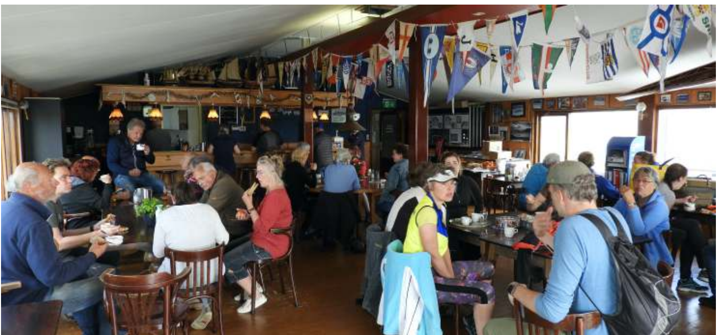
Een lunch na harde arbeid met een italiaans tintje gaat er goed in. In de middag gingen er ook nog een aantal leden aan de gang. Zo ontzettend veel werk is er verzet door 50 man op deze prachtige april dag.