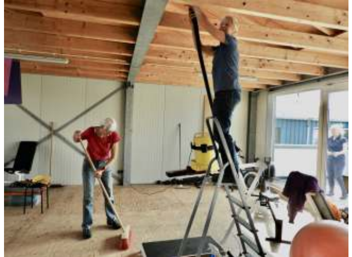
Conditiezaaltje ook weer schoon. Alle apparaten even aan de kant.