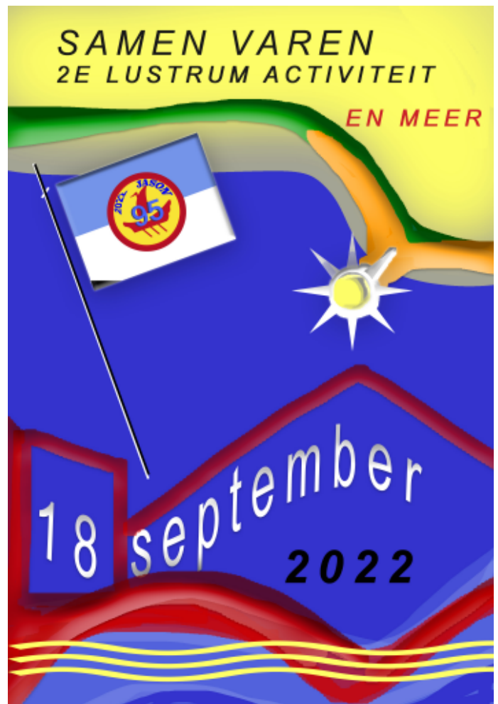
Er komt dus meer leuks in verband met ons 95 jarig bestaan.