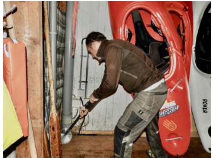
Precies wat het hoekje nodig heeft. Zou hij dit thuis ook doen?