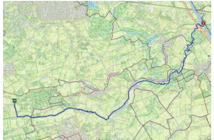
De Tungelroyse Beek, aanrader!