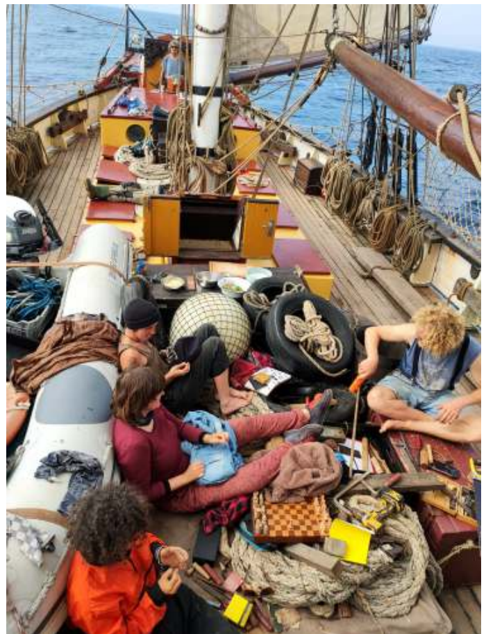
Als er geen wind is worden reparatieklussen aangepakt. Moet ook gebeuren en zo blijf je altijd bezig op het schip.