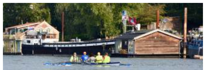
Op de Rijn kan ook in de winter gevaren worden mits de coronamaatregelen en veiligheidsregels dit toelaten.