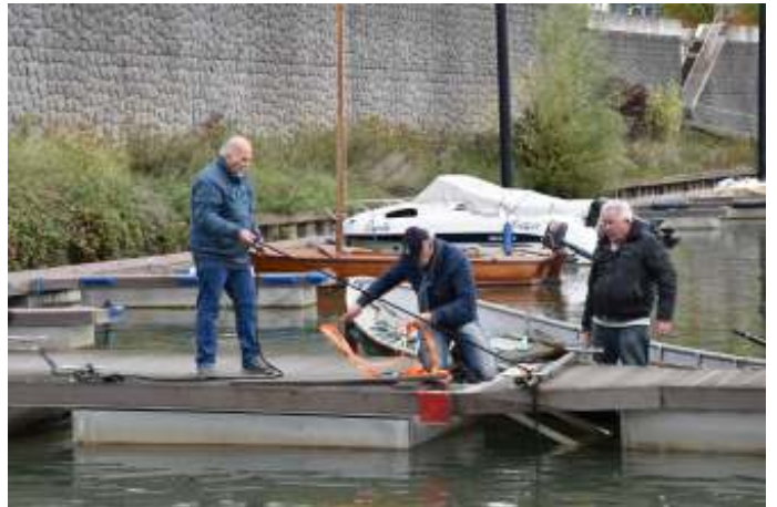
Tenslotte werden de steigers aangepast voor de nieuwe situatie als het clubschip weg is.