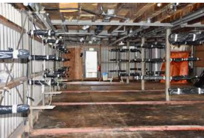
Alles wat eruit moest en worden ingepakt was gedaan. De vloer ofwel de vroegere sluisdeuren laat haar historie lezen.