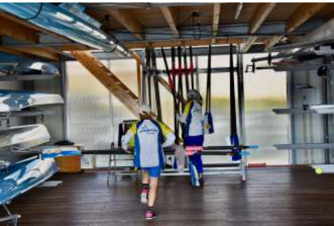
In de 2e roeiloods blijven boten beschikbaar zodat er beperkt geroeid kan worden. Ook bij andere watersportverenigingen en op Rhederlaag kan door ons geroeid worden, zie afschrijfsysteem op de website RV.