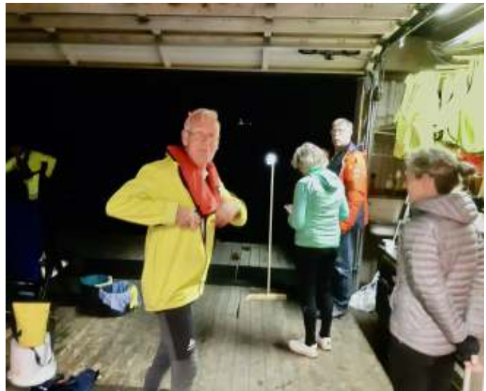
Wie is er bang in het donker?

Ter hoogte van het 'Blauwe Huis' maakten we rond, wisselden we van stuur en maakten ons klaar voor de terugtocht. Af en toe kwam de maan even achter de wolken vandaan om te kijken wat die drie lampjes op de Rijn betekenden. En verder was het heel erg stil. En mooi!!