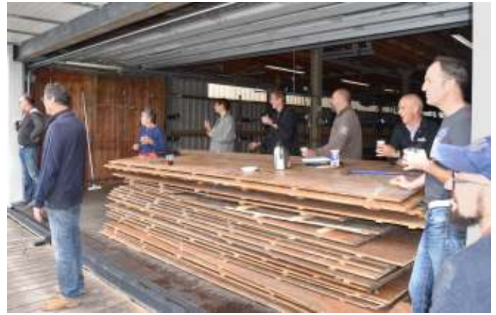
In het uitruimproces stonden de neuzen dezelfde kant op en dat werkt goed in deze situatie.