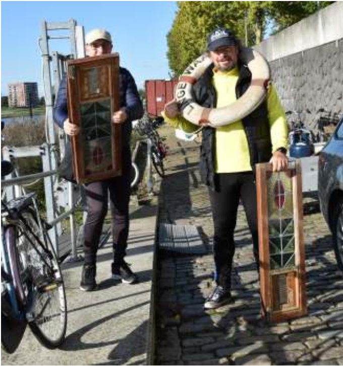
In het opruimproces worden overtollige oude spullen naar de stort afgevoerd. Zonde vinden deze twee heren en zo werd de berg vanzelf kleiner.