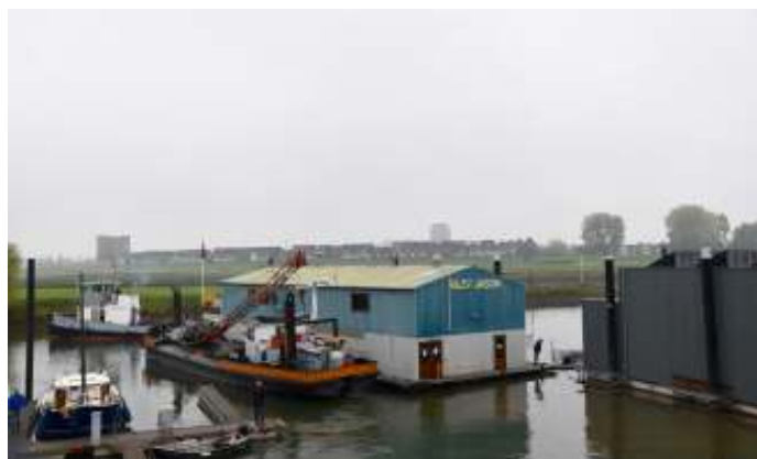
Op 19 oktober vertrok in de ochtend het clubschip naar de werf Misty.