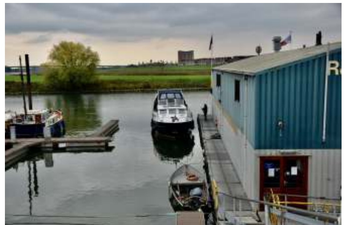
En de volgende dag in de late middag zag een passant dit unieke mooie plekje. Ach ja, waarom ook niet? Maandagochtend vertrek van het clubschip, in een volgend Baken meer hierover.