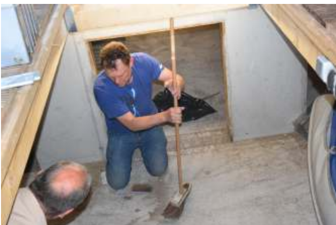
Op de knieën is soms wel zo gemakkelijk.