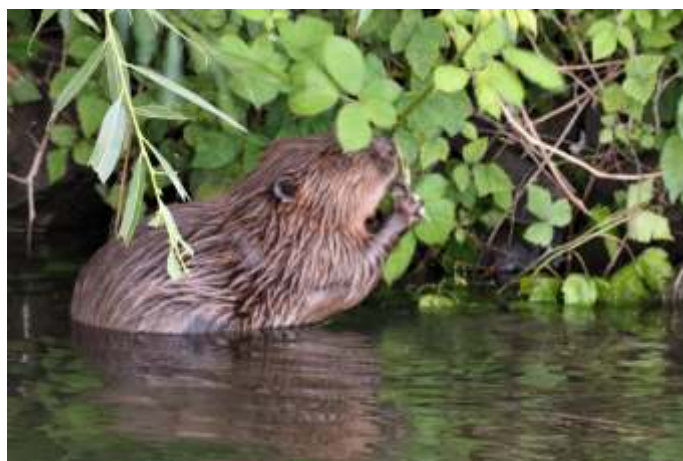
Knibbel knabbel knuistje, wie zit er in mijn huisje?