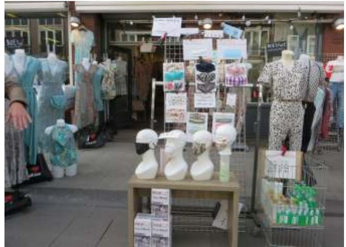
Ook over de zin en onzin van maskers werd ruimschoots gedebatteerd en het dragen ervan in het openbaar vervoer opgelegd op straffe van.

Wie rustig nadenkt hoe je jezelf het beste fysiek overeind houdt om de 'aanvallende ziektekiemen' te trotseren komt uit op de hoofdvraag, hoe krijg of behoud ik een goed immuunsysteem? Een vraag die je bij ieder seizoen moet stellen, niet alleen bij bedreigende onbekende ziektes. Aan een goed immuunsysteem moet je werken, altijd, niets gaat vanzelf. Wat hierin helpt is acceptatie dat je niet alles in de hand hebt. Als de angst regeert, zoals in het geval van Corona, helpen we daarmee deze onbekende 'aanvaller'. Angst maakt veel kapot. Een immuunsysteem kan alleen sterk blijven als je niet alles wat 'onrein' is uit de weg gaat. Alles uit de weg gaan maakt zwak en korte termijn winst kan zomaar omslaan in lange termijn verlies. Je ophangen aan beloofde verlossende pillen is niet verstandig. Niets nieuws onder de zon.