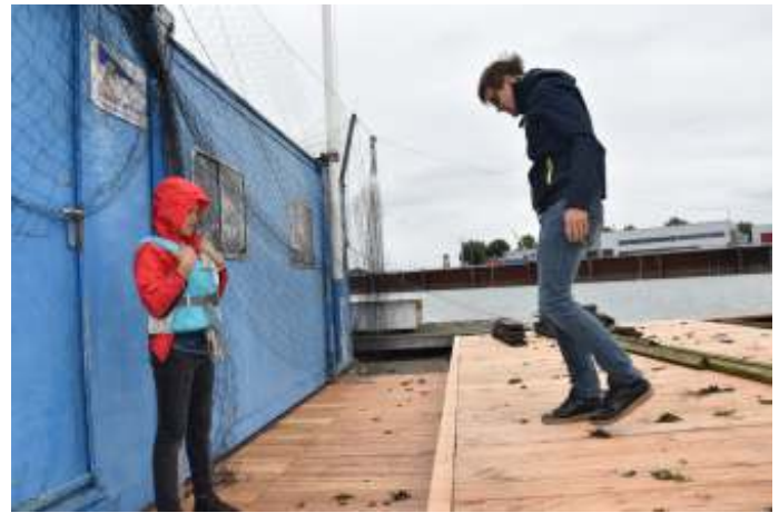
Nu moet je nog opletten waar je loopt, maar als alles klaar is wordt weer het vogelnet gespannen en zal deze smerigheid verdwijnen.