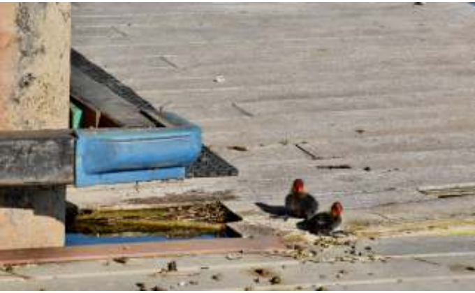
We komen uit hetzelfde nest, dus dan mag het.....