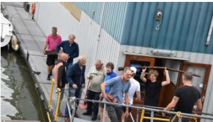
Sturm und drang