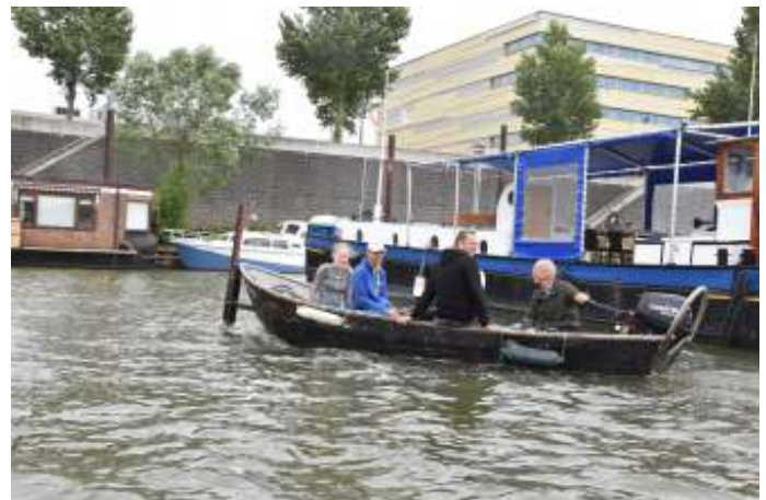
Op en neer om oude planken op te halen en nieuwe weer af te leveren op de dependance. Roei jeugd helpt mee.