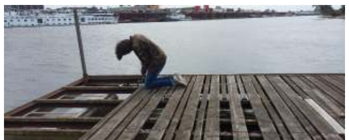
Alle vernieuwing begint met afbraak. Hier het vlot voor het leslokaal op de dependance in de haven.