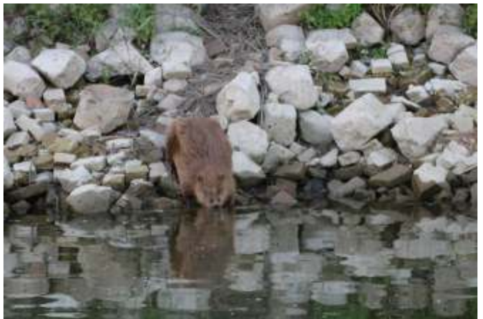
Lange tijd was de bever in onze haven alleen. Dit jaar liet zich ook een vrouwtje met kleintje in zijn hut zien.