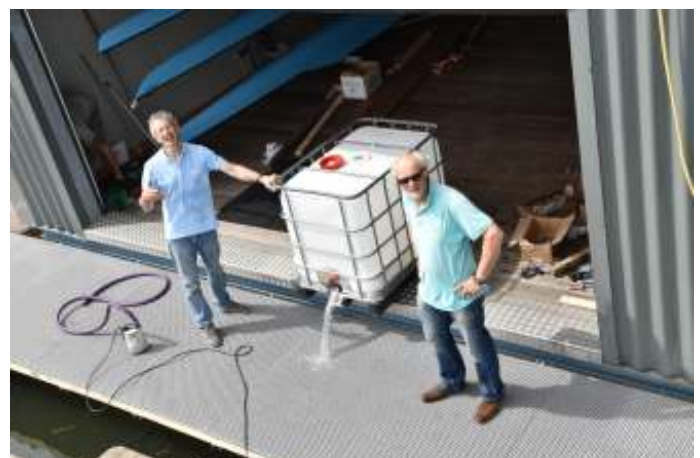
De heren zijn onder de indruk van zo'n krachtige straal. Dat zit wel goed vonden zij. Soms staan deze containers vol water gewoon in het weiland voor de dieren. Wij zoeken het wat lager. Een mooie vorm van ballasten.