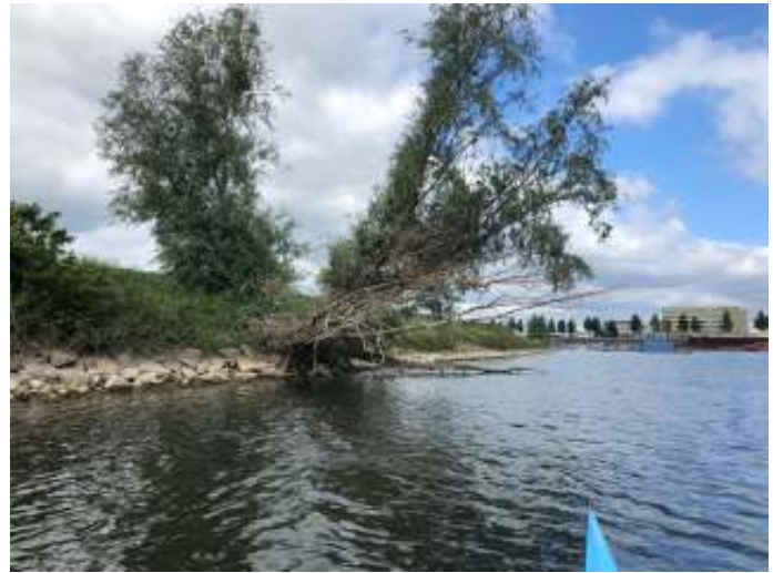
Het hol van de bever laat zich goed herkennen.

In de omgeving van Velp ZO, waar ik woon, ga ik veel naar buiten en wandel ik in de IJssel-uiteerwaarden. Geen dag is hetzelfde, mist, zon, wind, vogels, hazen, reeën, buizerds, meidoorn, fluitenkruid enzovoort.. In 2018 heb ik lang gepost met mijn camera bij gemaal Velperwaarden om ijsvogels mooi op de foto te krijgen. Dat is gelukt, na een maand of drie. Op een avond, al wachtend bij het gemaal, zag ik er een bruine schim bewegen met een platte staart, wauw dacht ik, zal dat echt een bever zijn? Of een beverrat? Het hol op