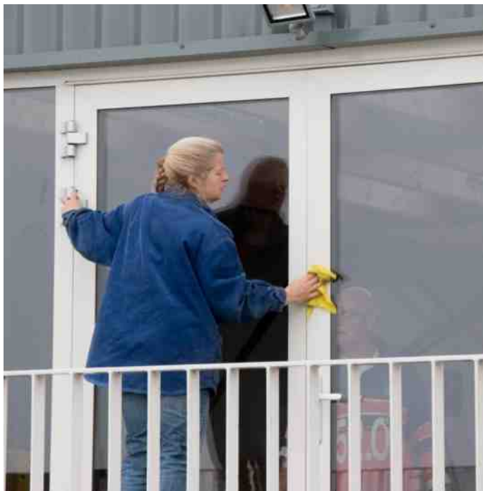
Glashelder dat dit moet. Kan je goed naar buiten kijken tijdens het ergometeren.