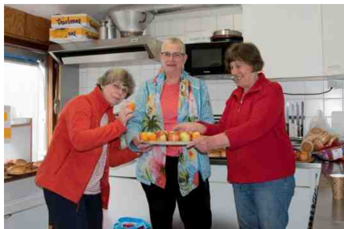
De kanoers vinden deze klus maar wat leuk.