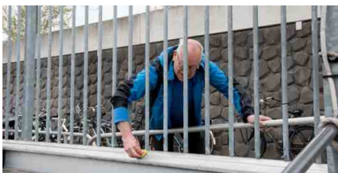
I want to get out.