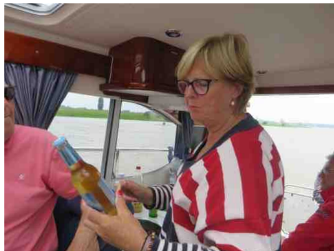
Prima flesje, zo worden roeiers snel ingewijd in het motorbootleven.