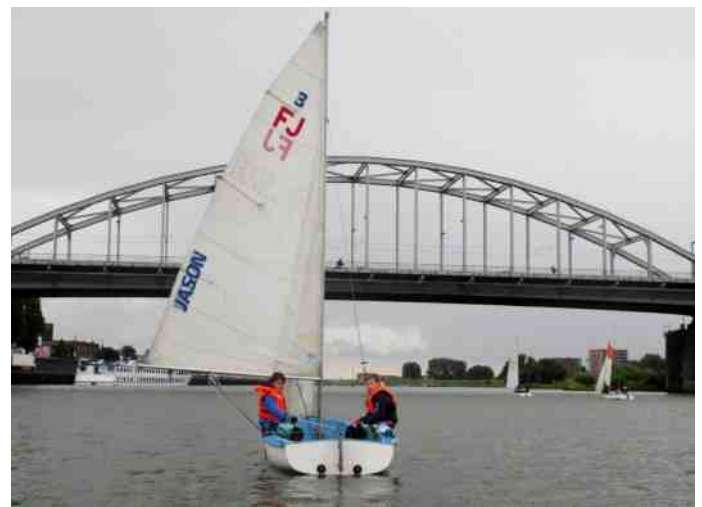
Op de heenweg was het weer iets beter dan terug. Wel constant goede wind en dat is voor een zeiltocht wel zo prettig.