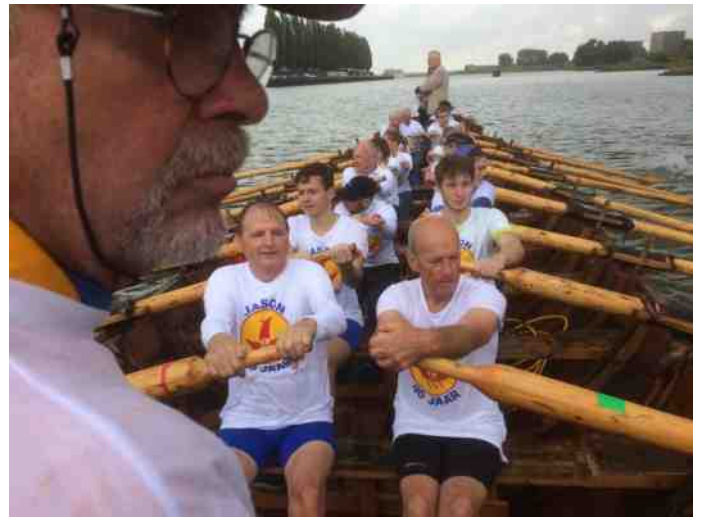
Op de terugweg