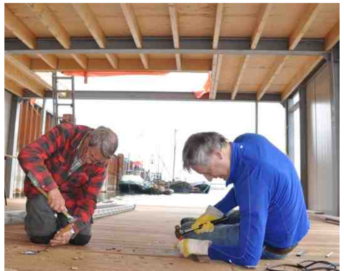
Niet alleen oog voor de grote constructie. Ook kleine elementen moeten kloppen.