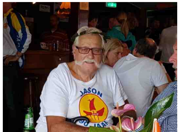
Gradus voelde zich eigenlijk ook wel een winnaar en terecht. Hij was de oudste in de Victoria en als ZM'er hoef je dit soort bewegingen gewoonlijk niet te doen om op het water vooruit te komen.