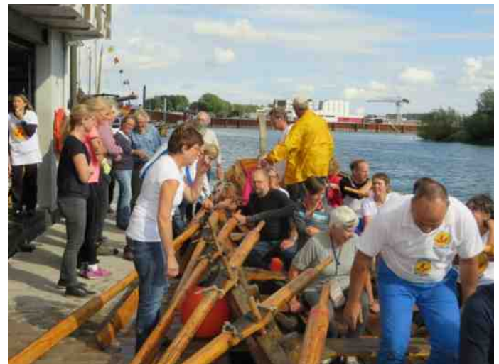
Na de tocht naar de stad werd vanaf 14.00 uur aan leden de mogelijkheid geboden om in de Victoria te roeien en met hun ploeg een snelle tijd neer te zetten. Vier ploegen waagden het erop. Mooie mix van leden in iedere rit. Het is wennen met al die verschillende lengtes van de palen. Zie dan maar een gelijke slag te krijgen, bijna een brug te ver.