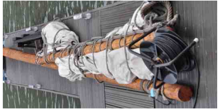
Helaas was het onderhoud aan deze boot nog niet klaar. We misten hulplijnen voor de mast en het zeil, dus met die harde wind een 'no go' voor het gebruiken van het zeil met opschrift. Een alternatief werd gezocht op de motorboot van Theodoor.