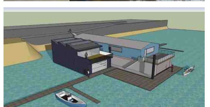
Voor einde jaar gaat de loods in gebruik. Een paar schilderactiviteiten vinden volgend jaar plaats.