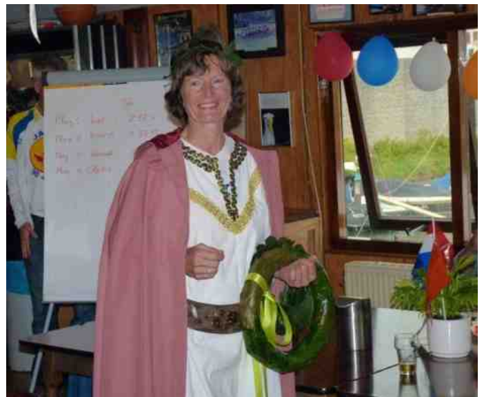
En plotseling verscheen godin Victoria in ons midden om de vier wedstrijd ploegen toe te spreken en de winnaars van een lauwerkransje te voorzien.