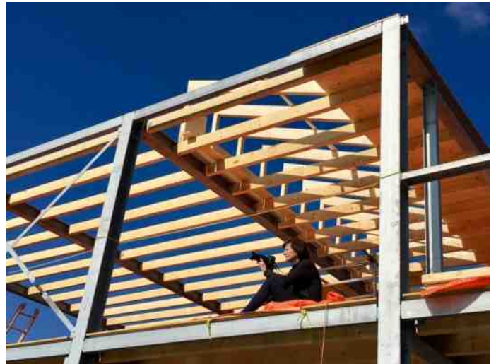
Hier nog luchtkasteel met prachtig uitzicht en goede ventilatie, Zo'n plekje in de zomer is niet verkeerd.