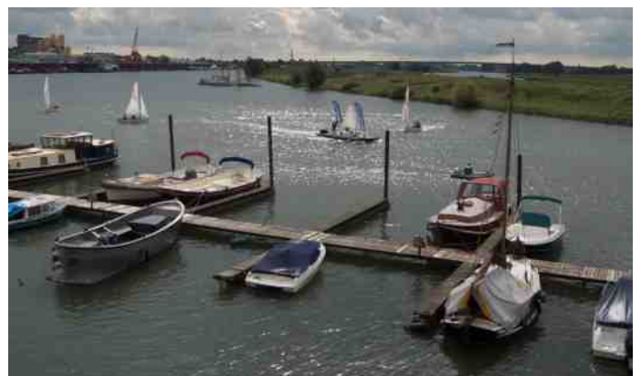
Als laatste vertrokken de FJ's en die deden er natuurlijk al kruisend wat langer over. Aan wind en regen geen gebrek.