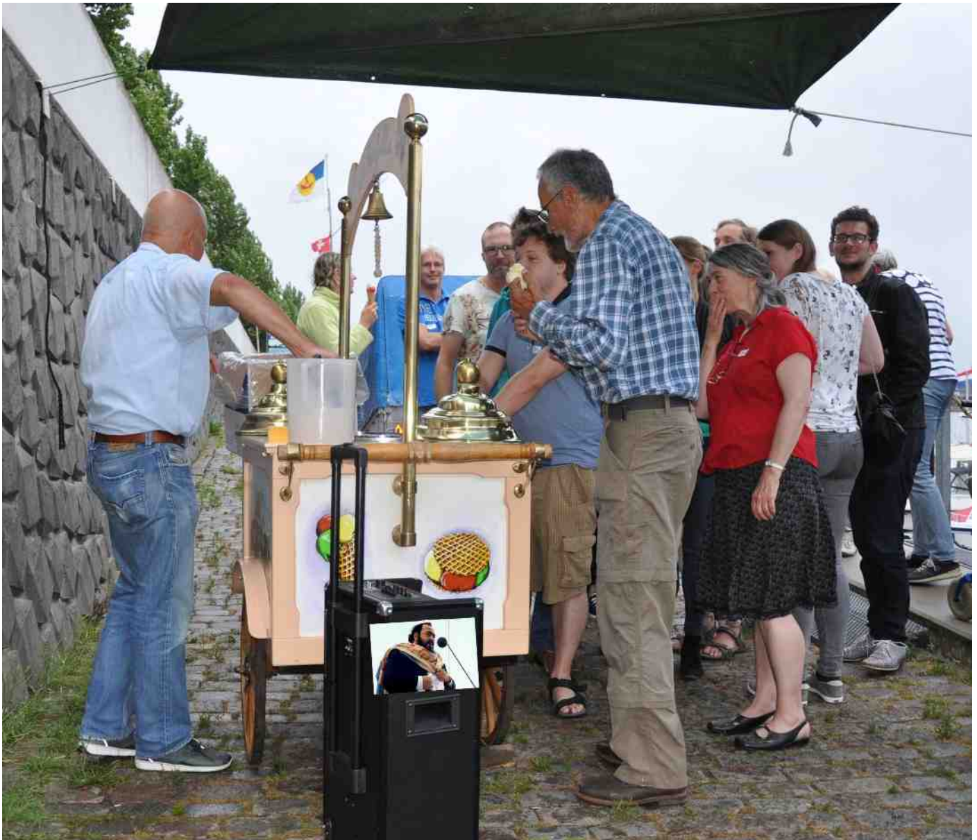
Als verrassing stond aan het slot van de avond een authentieke italiaanse ijskar klaar met ter plekke geïmproviseerd dakje tegen de regen. De eigenaar wilde zijn mooie oude ijskar niet blootstellen aan de doorgaande nattige omstandigheid.