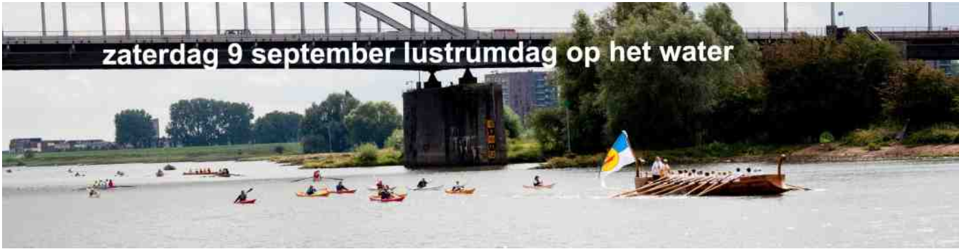
zaterdag 9 september lustrumdag op het water