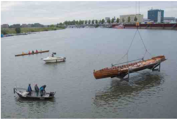
Tewaterlating Victoria bij werf Helldorfer. De speciale mal die voor de Victoria is gemaakt is ook noodzakelijk bij het vervoer over de weg. De boot kan niet zomaar van de ene plek naar de andere in Nederland gevaren worden en dat geeft dus extra rompslomp en kosten.