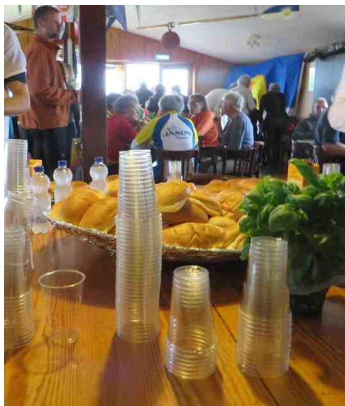
De broodjes stonden klaar voor de afgepeigerde Victoriagangers en de Armada aan meevarende boten die in weer en wind naar de stad voeren en weer behoorlijk nat terugkeerden op het honk. Na de lunch een aantal wedstrijdes in de haven. .