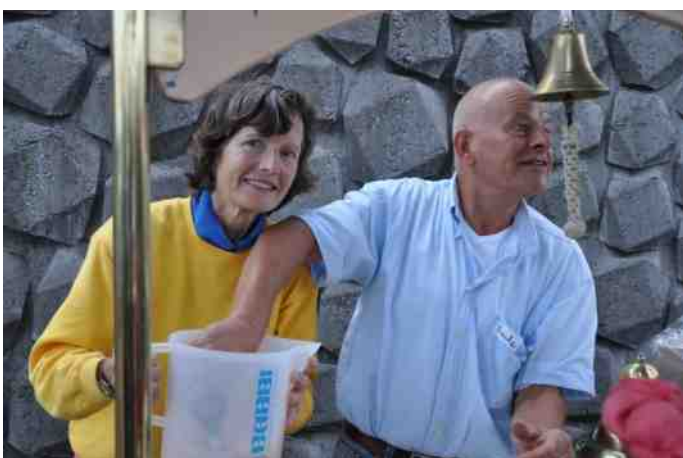
Ook passanten kregen een ijsje .....wie wil dat nou niet?