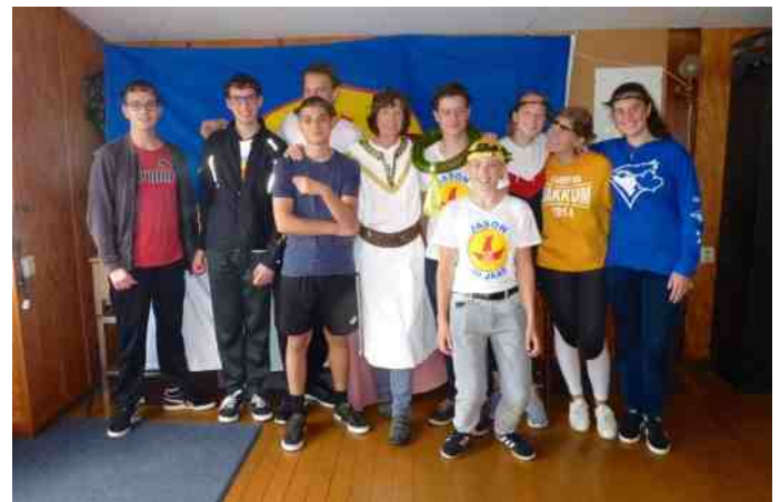
De jeugd kwam als snelste over de finish. Godin Victoria had incognito met ze meegeroeid en vond de gebruikte mantra "hi, ho" goed werken op de gelijkheid in de boot. Dat de bedoelde koers ook werd gevaren leverde een mooie eerste plaats op in het uiteindelijke Jasonklassement.