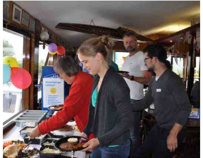
Salades, voor het vlees even naar beneden.