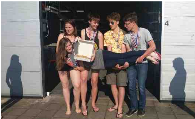
Voor en na de taart .....