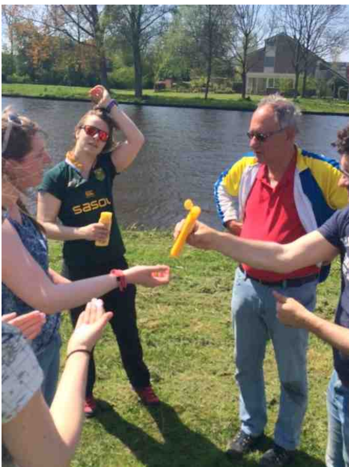
Extreem zonnig is deze roeimarathon geweest. Verbranding ligt op de loer en op een zonnesteek zit je ook niet te wachten, dus veel drinken en voldoende hartigheid naar binnen werken voor het juiste evenwicht.