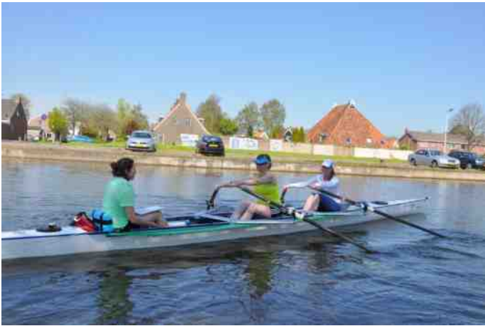
Strakblauwe lucht, zo mooi weer dat je moest oppassen om geen zonnesteek te krijgen.