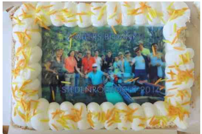
'Je bent om op te eten' gold zeker voor deze taart. Iedereen zocht zorgvuldig zijn stukje taart uit. Je eigen maatje eet je toch niet op of juist wel?