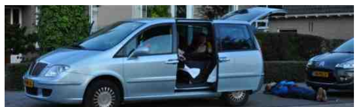
Diegene die zijn nachtrust op straat zocht kon na deze marathon weer vertrouwd het eigen bed opzoeken.