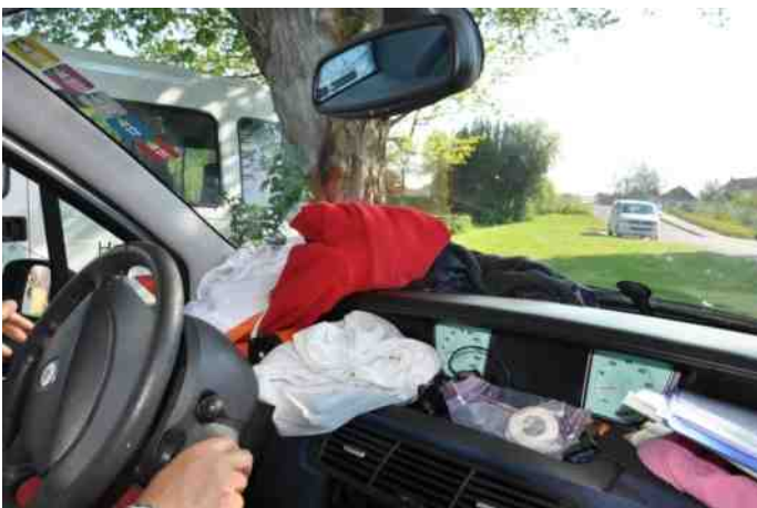
Hoeveel chaos kan je aan op zo'n tocht? Deze groep had er eigenlijk niet zoveel moeite mee.

toeschouwers ons een hart onder de riem steken. Wetterwielen is nog maar een kilometer. Hebben we het toch gehaald? De rest van het team wacht ons op en schreeuwt ons rennend door de laatste honderd meter heen. We komen over de finish en door het applaus van de andere teams die al aan het eten zijn weten we het zeker. We zijn binnen de tijd!