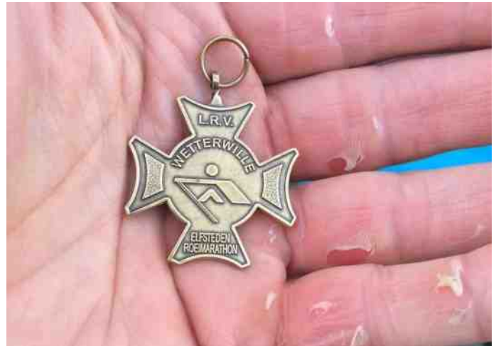
Op het nippertje is het begeerde elfstedenkruisje behaald. De muzikanten aan de finish hadden hun boeltje al gepakt in de verwachting dat het feest al klaar was. Dat het bereiken van de finish zonder muziek gepaard ging deed niets af aan de blijdschap van de Jasonploeg als het dan toch lukt. Het luide geklap van het publiek die, inmiddels ingelicht, met de ploeg meeleeft deed ook veel goed. Uiteraard zijn de goede voornemens gemaakt om het een volgende keer (volgend jaar al?) fysiek beter voor te bereiden, want een Elfstedenroeimarathon is echt geen toertocht .....