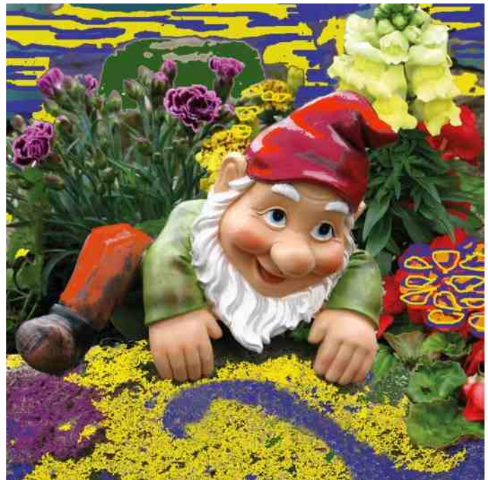
Als je goed oplet weet je wie de Jasonkabouters zijn.....