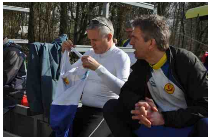
Zijn deze mannen wel met hetzelfde bezig?