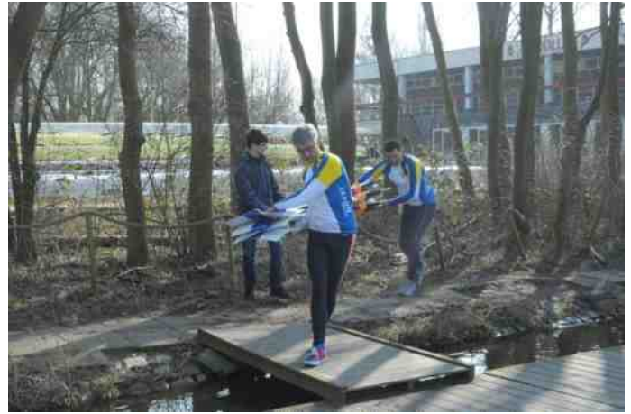
Ochtendgloren en op weg naar glory op het water?

Maar dan de 5000 meter die begint in wat bij de roeiers bekend staat als de Hoerenbocht, voor diegene die de Amstel niet kennen een echte chicane met