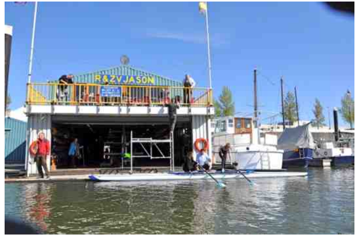
Werken aan een strak gele railing van het terras.

Het vermindert de houding van: ze doen dat wel, zonder een idee te hebben wie 'ze' zijn, maar jij dus niet. Verantwoordelijk gedrag kan niet op een paar