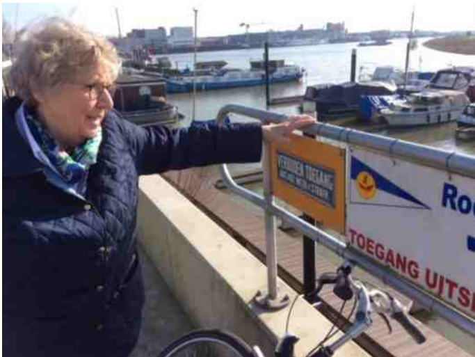
Mijmeren over een roeiperiode bij Jason heel lang geleden.