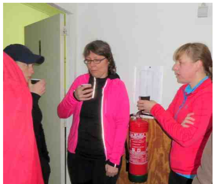
Lekker in het rose met een bakkie op de gang. Vrolijke aanblik is het zeker.