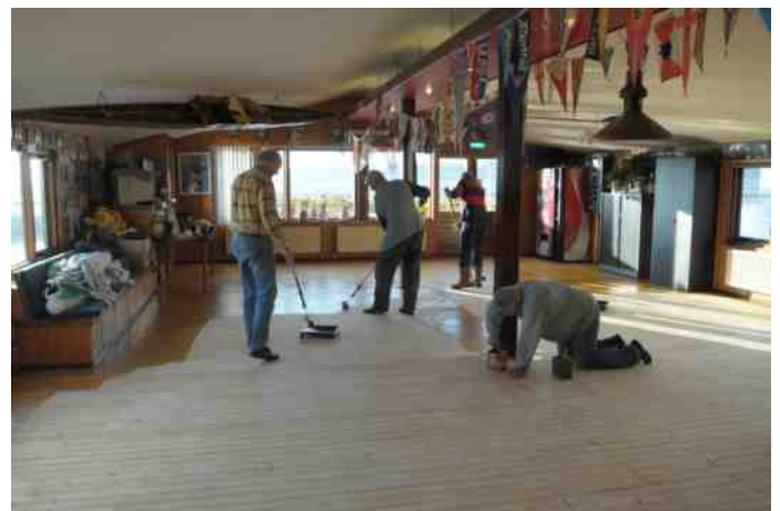
Schuren en schuren tot je een ons weegt. Of de mannen er heel slank door geworden zijn vertelt het verhaal niet. Dat de vloer met de nieuwe lak erop prachtig is geworden en weer jaren meekan is duidelijk. De clubkamer ziet er zonniger uit.