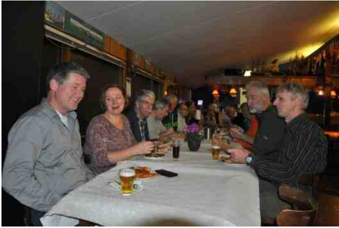
De zeilinstructeurs van Jason zijn niet vaak in de clubkamer want hun activiteit vindt op de dependance in de haven plaats en/of op Giesbeek bij speciale zeilevenementen.