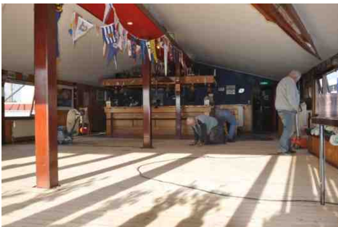
In de derde week van januari is gestart met het kaalschuren en lakken van de vloer in de clubkamer. Het weer was droog en zonnig wat ook lekker werkt. Het is ongelooflijk hoeveel licht dat binnen oplevert zo zonder meubilair. Met lak erop krijgt het zelfs iets van een ballroom.