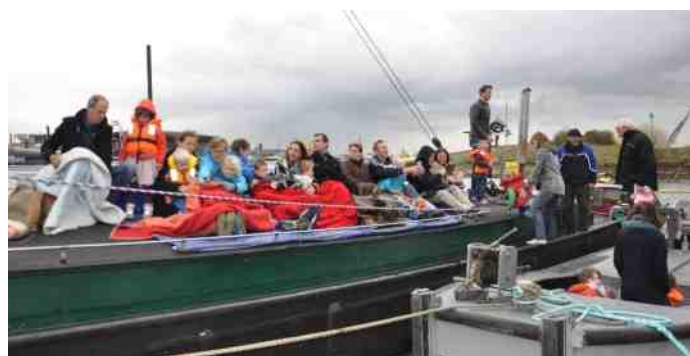
Op weg naar sinterklaas in flinke wind en regen. De kleuters vonden het prachtig.