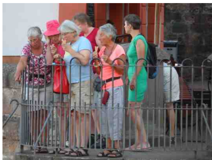
We kijken in bewondering naar de waterval in Saarburg, die middenin de Middeleeuwse stad een tiental meters naar beneden stort.