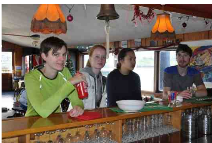
Nu het wat kouder is geworden vinden jeugdleden het wel chill aan de bar. Warme chocolademelk gaat er goed in.