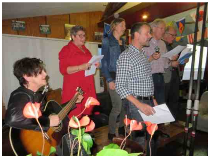
Uiteraard ook meezingers erbij.

de tweede wereldoorlog is ze erg bang geweest dat een overvliegende bom haar huis zou treffen. Ze hoorde ze aankomen en konden op een gegeven moment inschatten of ze in gevaar waren. Een erg angstige situatie. Aan het eind van de tweede wereldoorlog werd besloten dat alle inwoners van Arnhem de stad moesten verlaten. Mijn moeder, als jong meisje, dus ook. Ik kan je vertellen dat dit erg veel indruk op haar en haar familie gemaakt heeft. Ze waren blij dat ze in Loenen op de Veluwe een adres vonden waar ze tijdelijk mochten blijven. Met Arnhem is het tenslotte toch goed gekomen. Er zijn nu mensen die vluchten uit Syrië. Naast mensen die vluchten zullen er ook best een aantal economische gelukzoekers naar Europa komen. Aan onze autoriteiten de opdracht om hier verstandig mee om te gaan. (Dit loopt op dit moment, naar mijn mening, niet goed.) Ik hoop dat we mensen die echt op de vlucht zijn een onderdak kunnen bieden. Na verloop van tijd zullen zij waarschijnlijk graag terug gaan naar het land van herkomst, om dit verder op te bouwen. Ik denk dat veel onrust ontstaat uit onwetendheid en angst. Ik heb een gedicht gevonden dat hierbij aansluit.