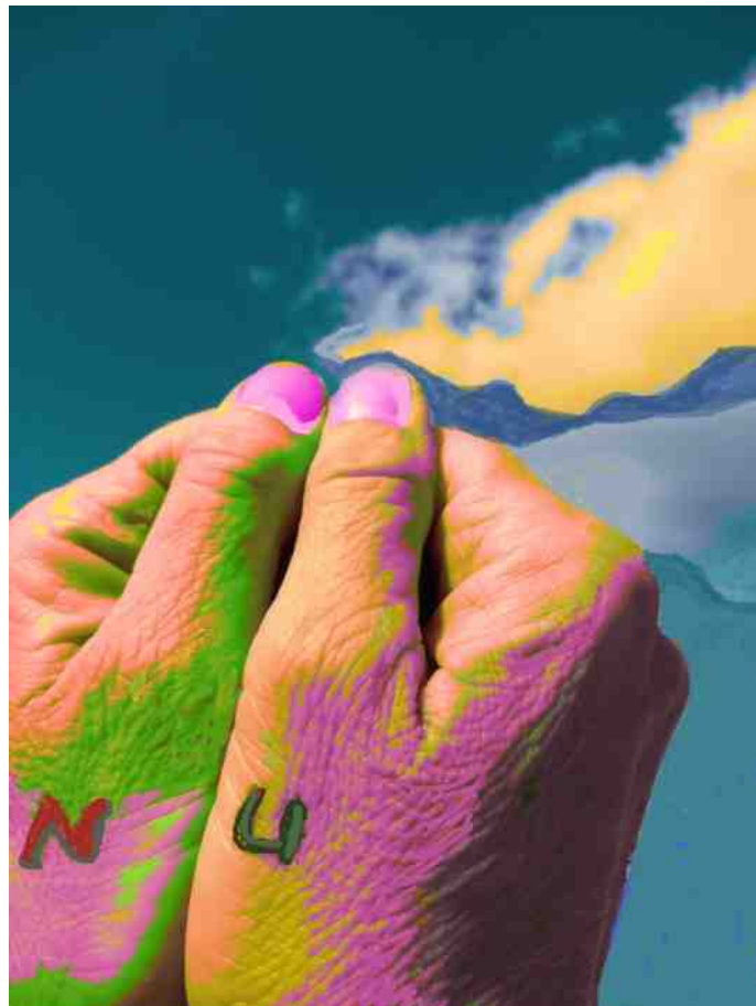
Onopvallend spieken blijft een uitdaging. Vroeg geleerd is oud gedaan.