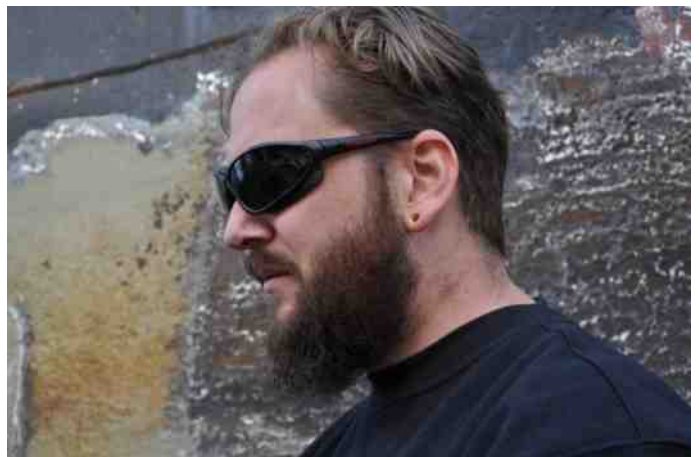
De eigenaar van de scheepswerf had zelf een mooi gat in zijn oor afgewerkt met kunststof. Hij houdt van zijn werk.