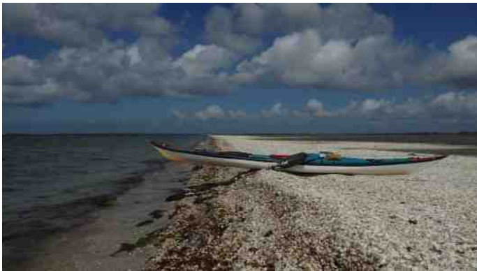
Grevelingen. Kajak op de schelpen