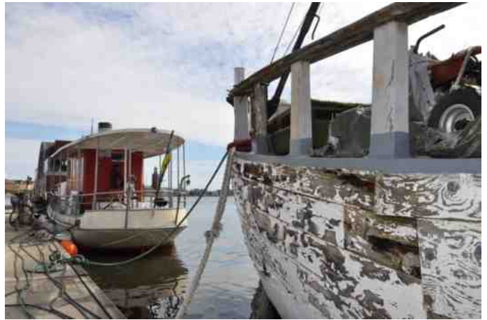
De afgebladerde houten wand van dit schip doet bijna grafisch aan.