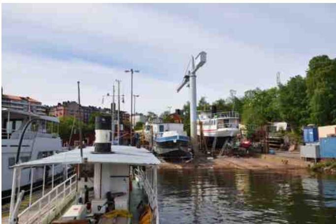
De helling van de werf.