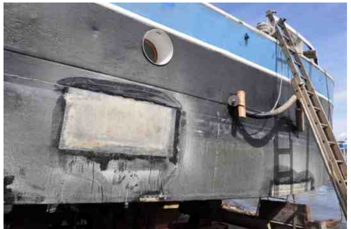
Repareren met kunstvezel.