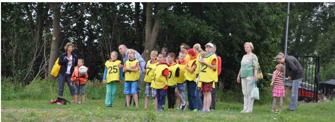
Palaver: instructie over de baan die gevaren gaat worden.