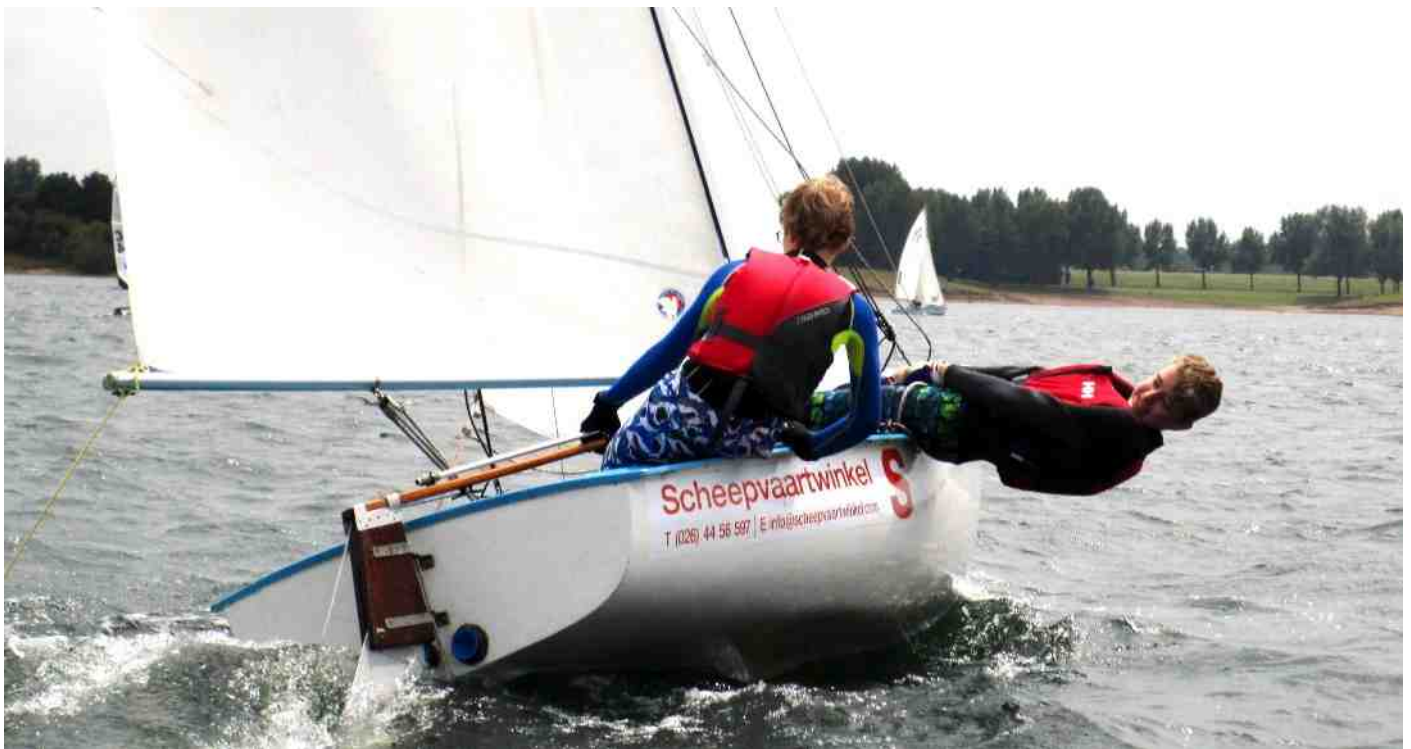
Niets mooier dan lekker buitenboord hangen bij sterke wind om nog sneller te varen, want je wil natuurlijk winnen.