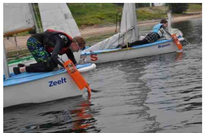
Wat doe je als er geen wind is zoals dat lang op zondag het geval was?