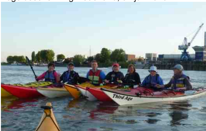
Genieten tijdens de clubavonden.