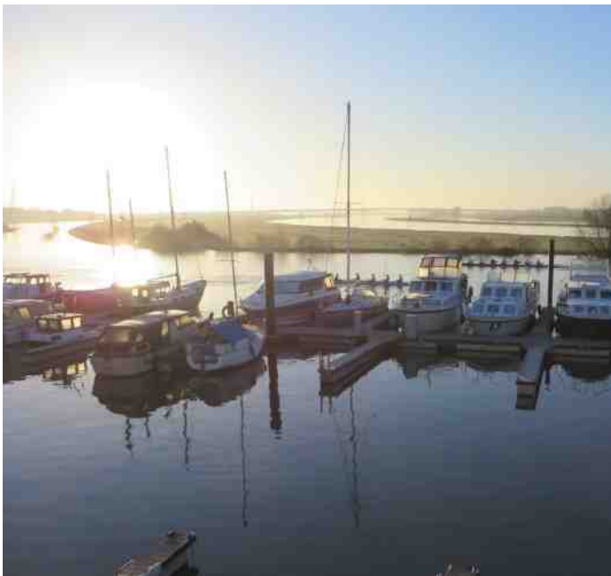
Een winterse ochtend in de haven bij Jason