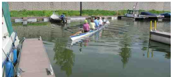
Tot het S4 examen behoort ook het zorgvuldig manoeuvreren in een box. Met harde wind is er geen tijd om over iedere commando lang na te denken. Oefening baart kunst.