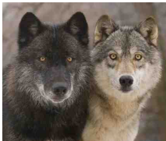
Welke wolf krijgt bij jou de meeste voeding?