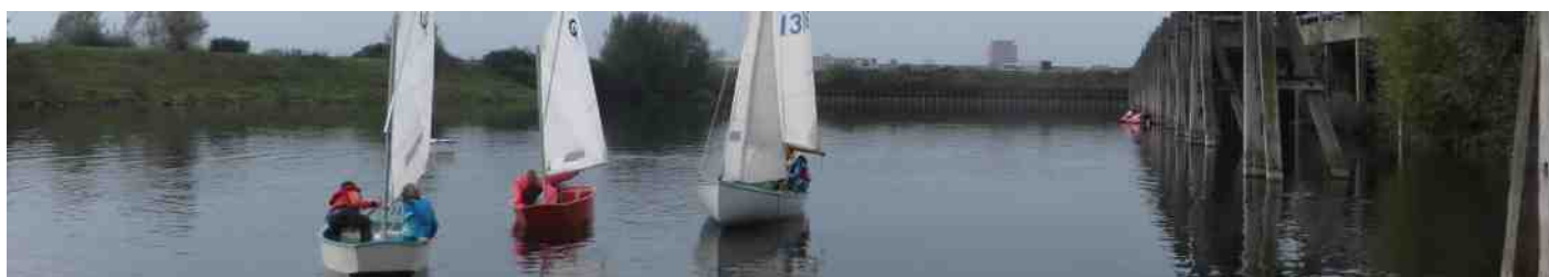
Tijdens de open techniekdag op bedrijventerrein de Kleefsewaard in oktober 2014 lieten onze jeugdzeilertjes hun vaardigheden in de boot zien en ook jonge passanten mochten instappen. Foto achterzijde is ook op die dag genomen.