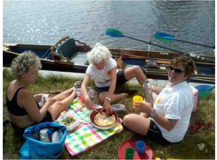
Je hebt stuurmans- en kookkunst; zaken die goed verenigbaar zijn.

Halverwege zijn wij uitgekomen in de Kalenbergergracht die een schakel is in de vaarverbinding tussen Blokzijl, het Giethoornsche Meer en de Friesche meren. Via de Kalenbergergracht zijn wij uitgekomen in Kalenberg. De geschiedenis van dit dorp wordt aanvankelijk vormgegeven door de turfwinning en de rietteelt. Met name het Kalenberger riet is een internationaal gewild bouw materiaal voor de rieten dakbedekking. De aan de Kalenbergergracht gelegen plaatselijke Ned. Hervormde kerk is herbestemd als een restaurant waar we onder het genot van een kop koffie/ thee even de benen hebben gestrekt. Kalenberg hebben wij via de Kalenbergergracht verlaten om vervolgens in het plaatsje Nederland gelegen Heer