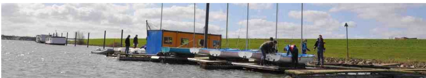
Ook de dependance werd door de jeugdzeilers met hun instructeurs onderhanden genomen.