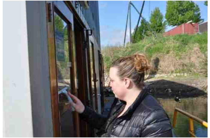
Ook de ramen krijgen een exrea beurt.