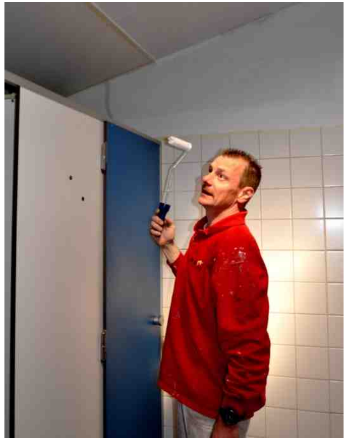
De herenkledkamer werd op een professionele manier gewit. Altijd fijn om kundige leden te hebben.