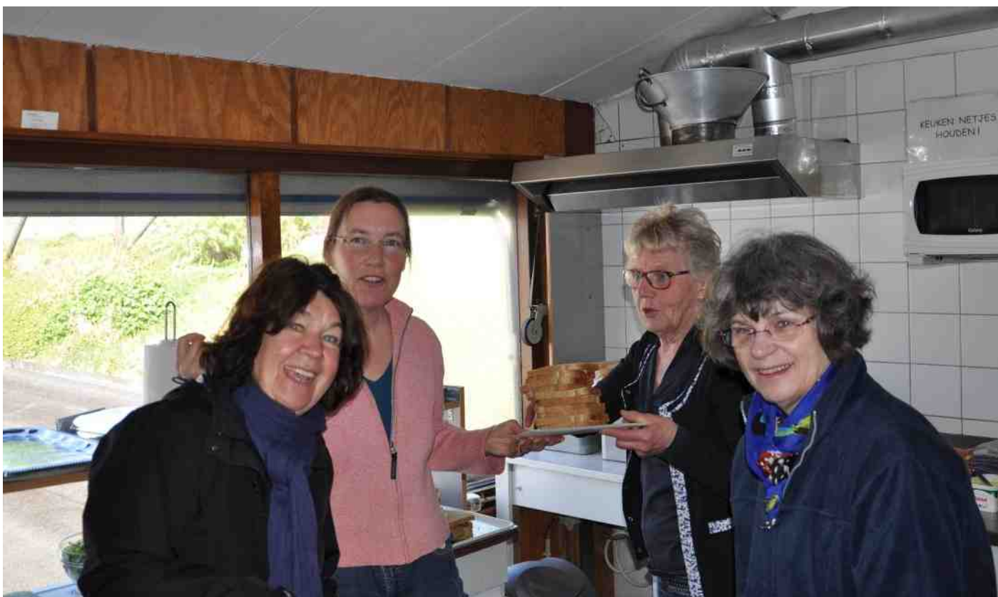
Aan hulp in de keuken geen gebrek. De lunch was weer heerlijk voor de harde werkers...