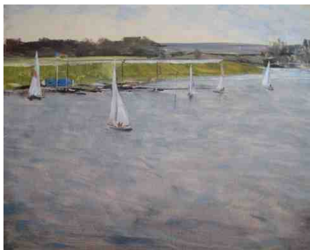
Afbeelding van: René Melenberg

Meer over de Rijnrace vind je op de vernieuwde website, www.rijnrace.nl .