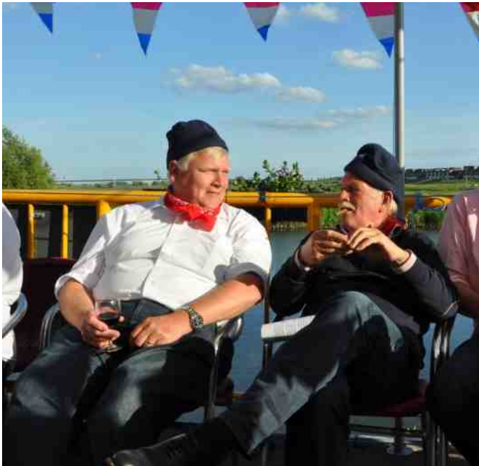
Het is geen toeval dat deze twee heren naast elkaar zitten. Een nieuwe voorzitter zit in het vat.