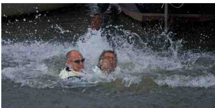
En de winnaars uit de KV mochten afkoelen in het water.....