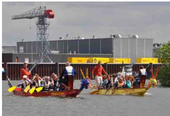
Nek aan nek races