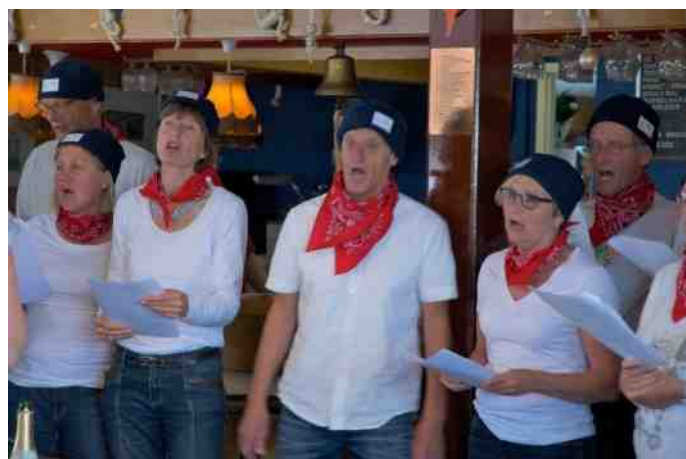
Het Jason-shantikoor kreeg uiteindelijk iedereen in de clubkamer aan het zingen.