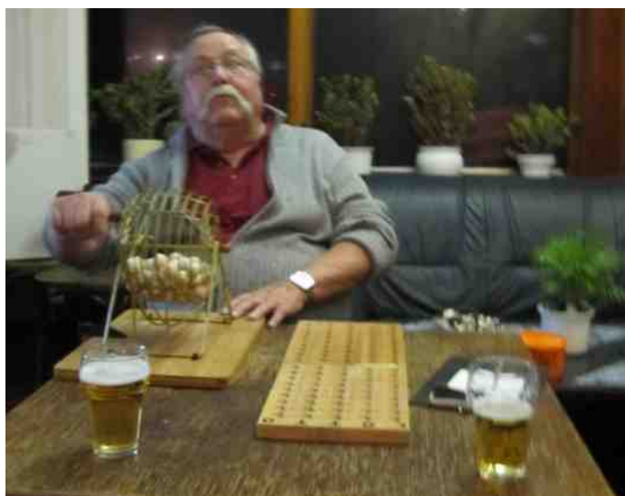
Bingo of niet?