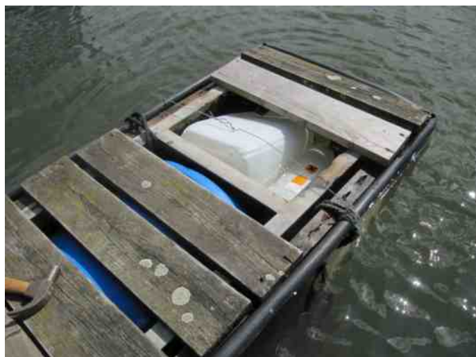
Orginele oplossing voor drijvend houden oude steiger.

Goed onderhoud blijft van voortdurende zorg voor ons allemaal. Onze inspanningen op dat gebied worden beloond in de sportbeoefening en de faciliteiten daaromheen in onze vereniging.